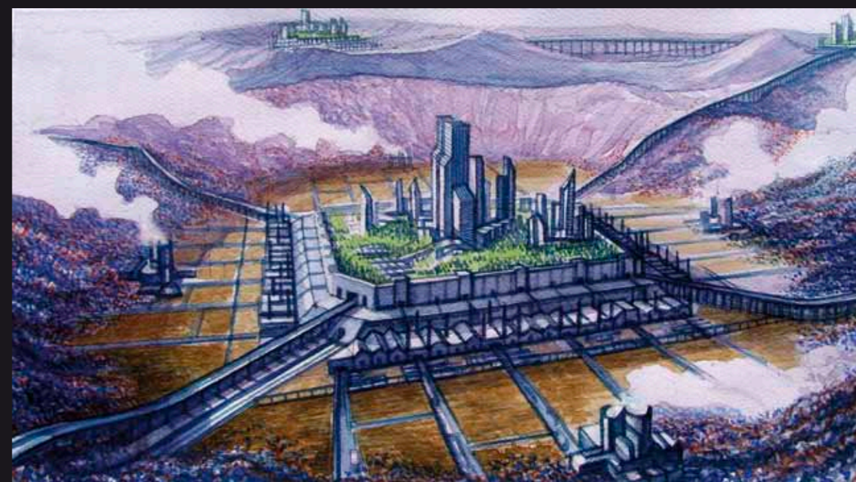
nella pagina precedente: "Le città e la memoria". in questa pagina (dall'alto): "Le città e gli occhi" e "Le città continue".