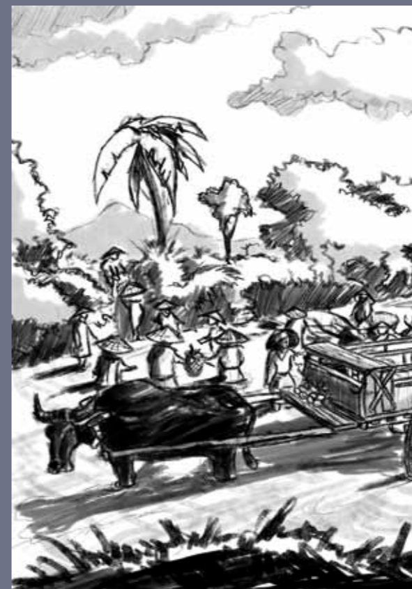
in alto e nella pagina precedente: bozzetti per My Lai Four (2009).