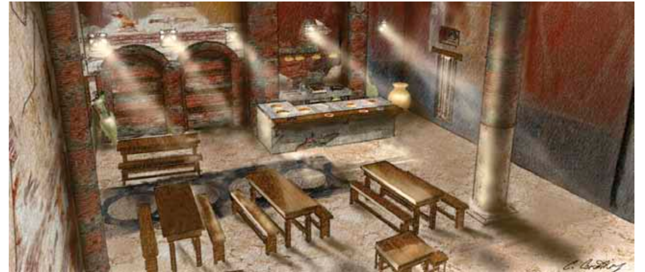
in queste pagine bozzetti di Claudio Cosentino per: (in alto) la locanda di Caligola (2010) e (a sinistra) il tempio di The Tomb (2004).

Zombie the beginning si conclude con uno scontro finale fra dei marines sbarcati da un sommergibile e degli organismi geneticamente modificati prodotti da una multinazionale farmaceutica. È una summa delle migliori pazzie di Bruno Mattei, un'apoteosi di generi perché raccoglie mostri di ogni tipo, zombie, cannibali e vampiri. Tutti gli abomini che solo la sua mente diabolica poteva partorire. È stato infinitamente divertente lavorarci perché abbiamo potuto dare sfogo a tutte le idee. Bruno è scomparso poco prima che venisse ultimato e purtroppo non ha fatto in tempo a vedere il suo film più bello. Forse non ha mai realizzato un film sociale e si è semplicemen-