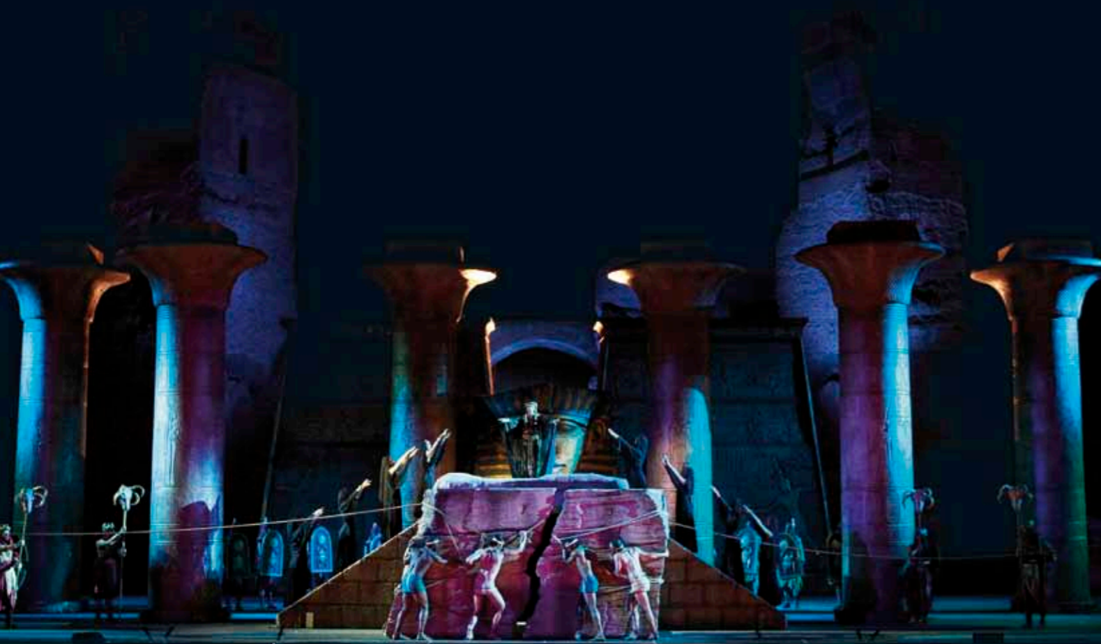
scenografia di Andrea Miglio per l' Aida allestita alle Terme di Caracalla